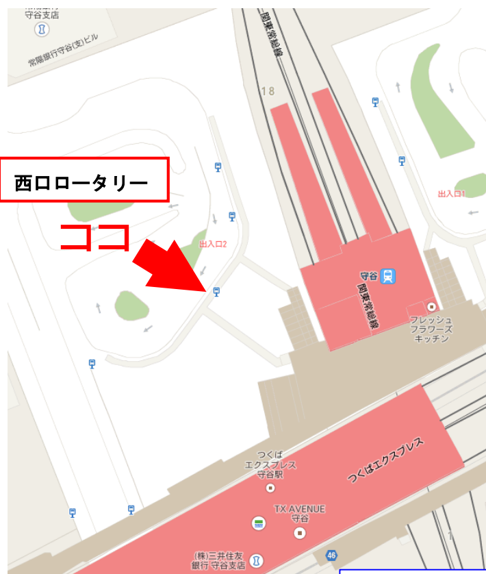
■下車後徒歩案内図